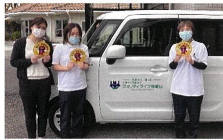
クオリティライフ和歌山 様