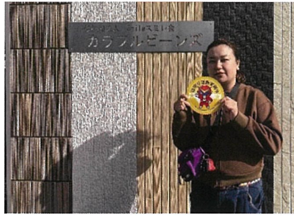
カラフルビーンズ 様