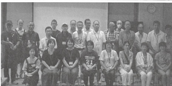
※写真撮影時のみマスクをはずしています

壊れたおもちゃの修理を通して、子どもたちに「ものを大切に作る気持ち」を伝えるおもちゃのお医者さん“おもちゃドクター”を養成する講座を開催しました。 30代〜70代と、幅広い年齢の方々が受講され、18人のおもちゃドクターが生まれました。 今後は、ボランティア団体を立ち上げ、町内に「おもちゃ病院」を開院し、活躍の場を広げてまいります！