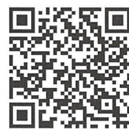
《後見ポータルサイト》

どうせんたー そうだん もうしたてしよるい さくせいほうほう せつめい A. 当センターへご相談くだされば申立書類の作成方法について説明します。 さくせい むずか ばあい いっしょ さくせい 作成が難しい場合は一緒に作成することができます。 かにさいばんしょ こうけんぼ ーたるさいと ほーむぺーじ また、家庭裁判所「後見ポータルサイト」ホームページから もうした ひつよう しよるい だうんろーど かのう 申立てに必要な書類のダウンロードが可能です。