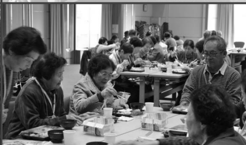
ひとり暮らし高齢者の食事会