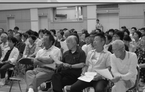
ボランティア研修