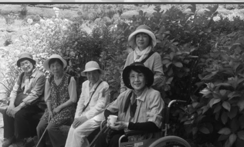
ひとり暮らし高齢者の遠足