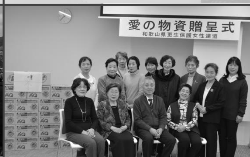
愛の物資贈呈事業