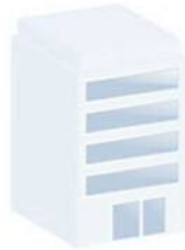
[有田川町社会福祉協議会]