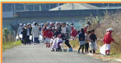
クリーン有田川運動