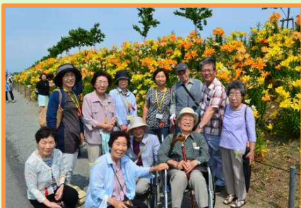
ひとり暮らし高齢者遠足